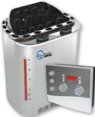
SAWO SCANDIA Bio-Combisaunaofen