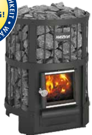
HARVIA LEGEND 150